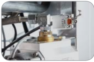
Сигнализация открытия дверец