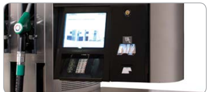
Модули оплаты (CRIND)