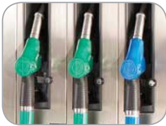
Замки на пистолеты