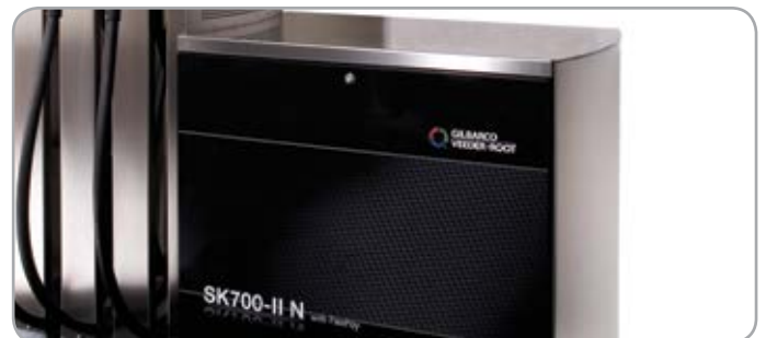
Панели из нержавеющей стали